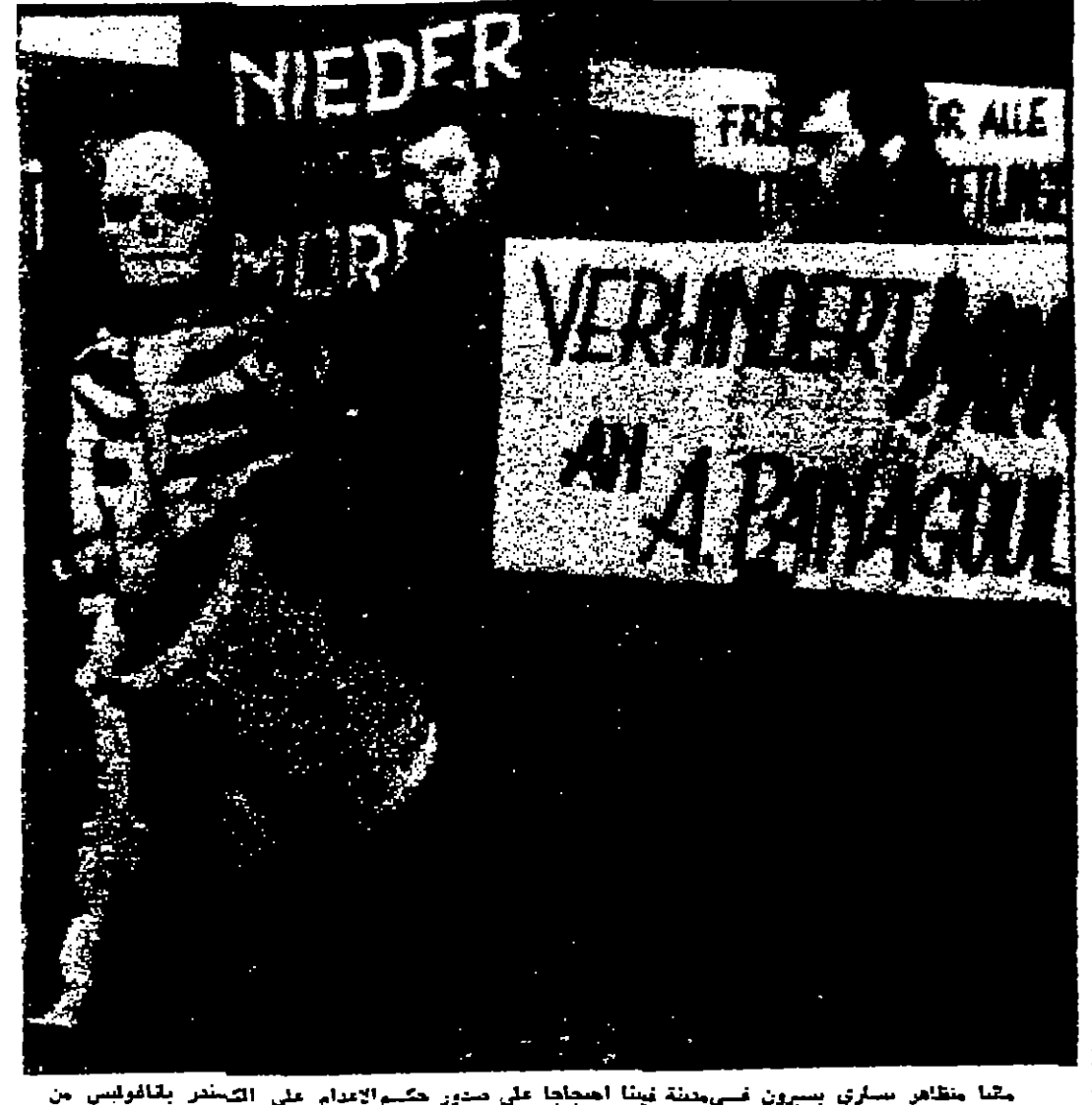
محا مظهر ساري بيرون غسي مدينة فينا اصحابها على صدور حكم الاعدام على الصحفر بالقافوليس من المحكة العسكرية اليونانية احواته اغتيال رئيس الوزراء اليوناني جورج بانابولوس بقاء قبيلة على سيارته وكان المتقارون يحملون اعلاما كتب عليها بعض عبارات المنيد بالتحرك العسكريين في اليونان